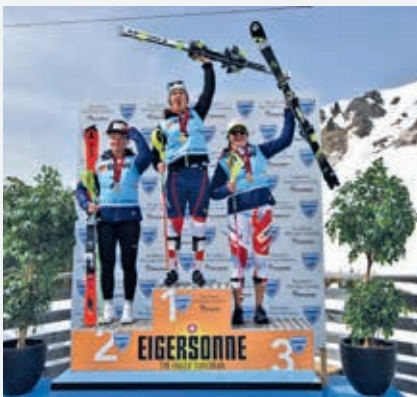
ab 20 Personen | CHF 20.– pro Person