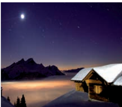
ab 40 Personen | CHF 48.– pro Person